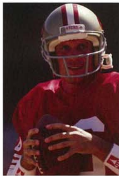
サンフランシスコ49ersを率いてスーパーボウル優勝4回の偉業を成してNFL名譽の殿堂入りを果たしたQBジョー・モンタナ(ノートルダム79年卒業)も親善大使として来日する

国際アメリカンフットボール連盟主催のワールドカップで99、03年優勝、07年準優勝と世界のアマチュア・フットボール界のリーダーとしての一翼を担う日本フットボール界が、本場米国の超一流に對しどんな闘いを繰り広げることができるか。日本フットボール界が総力をあげて取り組むチャレンジを、ぜひ、お見逃しなく。