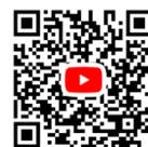
公式 YouTube チャンネル