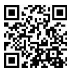
上月財団ウェブサイト